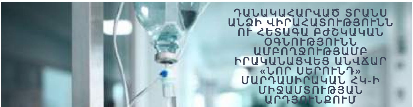
Դանակահարված տրանս անձի վիրահատությունն ու հետագա բժշկական օգնությունն ամբողջությամբ իրականացվեց անվճար «Նոր Սերունդ» Մարդասիրական ՀԿ-ի միջամտության արդյունքում

2018թ.-ի ապրիլի 15-ին երեկոյան ժամը 02:30-ի սահմանում իր վարձակալած բնակարանում դանակահարվել է տրանս* անձ XX-ը: Վերջինս համացանցի միջոցով ծանոթացած տղամարդու հետ ձեռք է բերել հանդիպման պայմանավորվածություն: Անձանոթ անձը չարաշահելով XX-ի վստահությունը, մուտք է գործել նրա բնակարան, սրճել, զրուցել: Այնուհետև, երբ տուժող XX-ը շրջվել է թիկունքով դեպի անձանոթը, վերջինս քաշել է XX-ի մազերից և դանակով հարվածել պարանոցին: Դանակը մխրճվել է XX-ի կոկորդը: Անձանոթ անձը հեռացել է տանից, իր հետ վերցնելով Տուժողի հեռախոսը (iphone 7), mitsubishi մակնիշի ավտոմեքենայի բանալիները և տղամարդու բաճկոնը: Տուժող XX-ը դանակահարող անձի հեռանալուց հետո, գրեթե ուժասպառ վիճակում, հանել է դանակը կոկորդից և սողալով հասել մինչև հարևանի դուռը: Հարևանները շտապ արձագանքել են, զանգահարել Շտապ օգնության ծառայություն և օգնել վիրավորին մինչև բժիշկների մոտենալը: XX-ը տեղափոխվել է Էրեբունի բժշկական կենտրոնի վերակենդանացման բաժանմունք, որտեղ էլ առավոտյան ժամը 06:20-ի սահմանում ենթարկվել է վիրահատության: