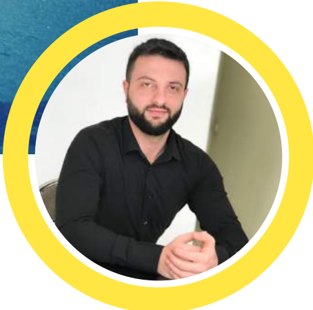
ԱՎԵԼԻ ԱՆՎԱԽ ԵՆՔ

Մասսայական անհնազանդության խաղաղ ցույցերը հանգեցրին հնացած ու կոռումպացված ռեժիմի փլուզմանը: Այն կոչվեց Թավշյա հեղափոխություն, քանի որ մարդիկ ժողովրդավարության անսխաղեպ հաղթանակի հասան առանց որևէ կրակոցի: Անհնազանդության գործողությունները փոքրամասնությունների համար պատմական ու շրջադարձային կետ դարձան: