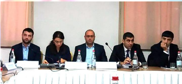
Քրեակատարողական հասարակական հիմնարկներում վերահսկողության

դիտորդական խումբն այսօր ներկայացրել է 2014-15թթ.-ի հաշվետվությունը: Այնտեղ հստակ նշված են այն խնդիրները ու խոչընդոտները, որոնց հիմնականում առնչվում են ազատագրված մարդիկ: Դիտորդական խմբի անդամները, բացի արձանագրված խնդիրներից նաև ուշադրություն հրավիրեցին այն հանգամանքին, որ ՀՀ արդարադատության նախարարության քրեակատարողական հիմնարկներում եւ մարմիններում