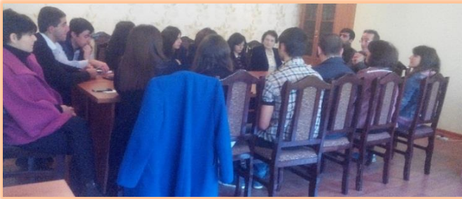
Տավուշի մարզ, ք. Իջևան, Մարտի 9, 2016 թ.

Մարտ ամսվա ընթացքում «Այլընտրանքային գինվորական ծառայության մասին» ՀՀ օրենքի վերաբերյալ քննարկումներ տեղի ունեցան ՀՀ Տավուշի, Գեղարքունիքի, Արագածոտնի, Արմավիրի, Արարատի, Վայոց Ձորի, Կոտայքի մարզերում և Երևանում: