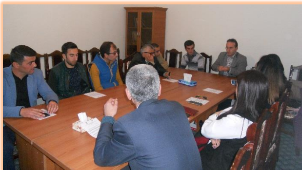
Արարատի մարզ, ք. Արտաշատ, Մարտի 21, 2016 թ.

Ըստ իրավապաշտպանի՝ տարբեր տեսակի զենքերի, այդ թվում նաև քիմիական զենքի մանրամասն նկարագրությունների փոխարեն կարելի է անդրադառնալ զինվորական ծառայության իրավունքների հետ կապված հարցերին: