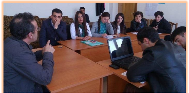
Գեղարքունիքի մարզ, ք. Գավառ, Մարտի 9, 2016 թ.

Քննարկումների նպատակն էր բարձրացնել հանրության իրազեկվածության մակարդակը ՀՀ Չինված ուժերում խոցելի խմբերի իրավունքների պաշտպանության և համապատասխան պաշտպանական մեխանիզմներ մշակելու կարևորության մասին: