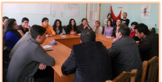
Արմավիրի մարզ, ք. Արմավիր, Մարտի 10, 2016 թ.