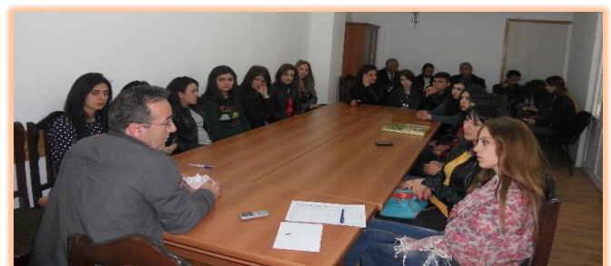
Վայոց Ձորի մարզ, ք. Եղեգնաձոր, Մարտի 29, 2016 թ.

Նմանատիպ քննարկումները, բանախոսի և մասնակիցների համոզմամբ, օգնում են բարձրաձայնել խնդրո առարկա օրենքում նոր փոփոխություններ կատարելու անհրաժեշտության մասին: