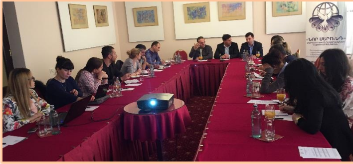
Երևան, Մարտի 21, 2016 թ.

Խնդրահարույց է նաև այն, որ եթե անձը բանակում է փոխում կրոնական համոզմունքը, ապա նրան թույլ չի տրվում անցնել այլընտրանքային զինվորական ծառայության: Բացառվում է մարդու՝ երկու տարվա ընթացքում համոզմունքների փոփոխությունը, ինչը, բանախոսի համոզմամբ, ակնհայտ խախտում է: