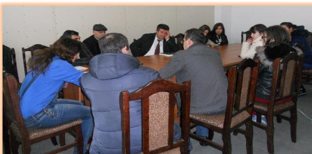
Կոտայքի մարզ, ք. Հրազդան, Մարտի 29, 2016 թ.

Հանդիպումներին մասնակցել են նշված մարզերի մարզպետարանների իրավաբանական, զորահավաքային նախապատրաստության, մարզկենտրոնների քաղաքապետարանների աշխատակիցներ, հասարակական կառույցների ներկայացուցիչներ և ուսանողներ: